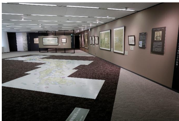
▲第2章 伊能図の出現と近代日本