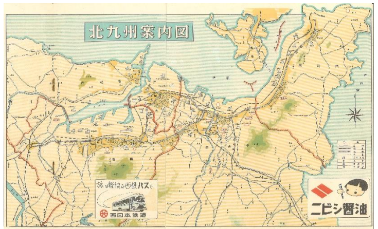
▲最新北九州五市市街地図 昭和33年(1958年)頃