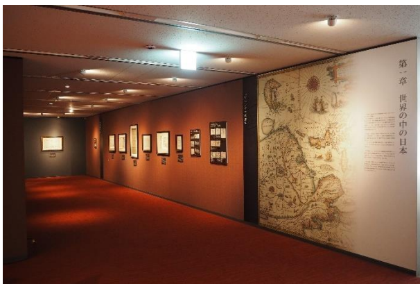
▲第1章 世界の中の日本