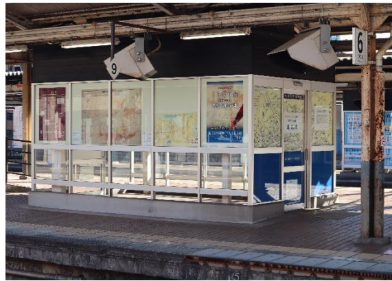
▲5・6番のりばの旧喫煙ルームを活用した展示スペース