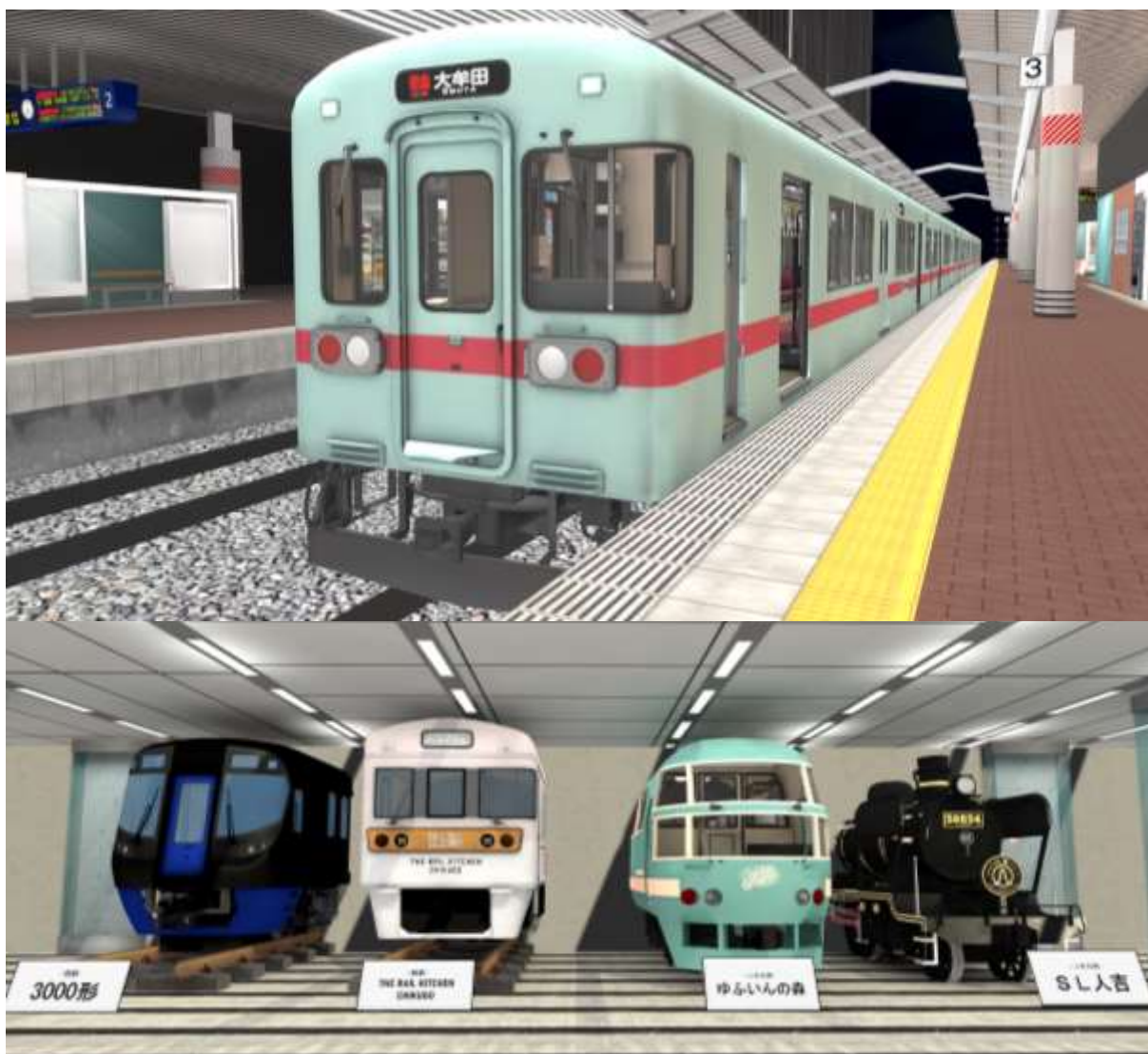
※画像は開発中のものです。

※スマホ・タブレット・PC では「3・4番のりば」がありません。コンコースにおいて、西鉄とJR九州の列車、合計4両の先頭部分の展示をご覧ください。