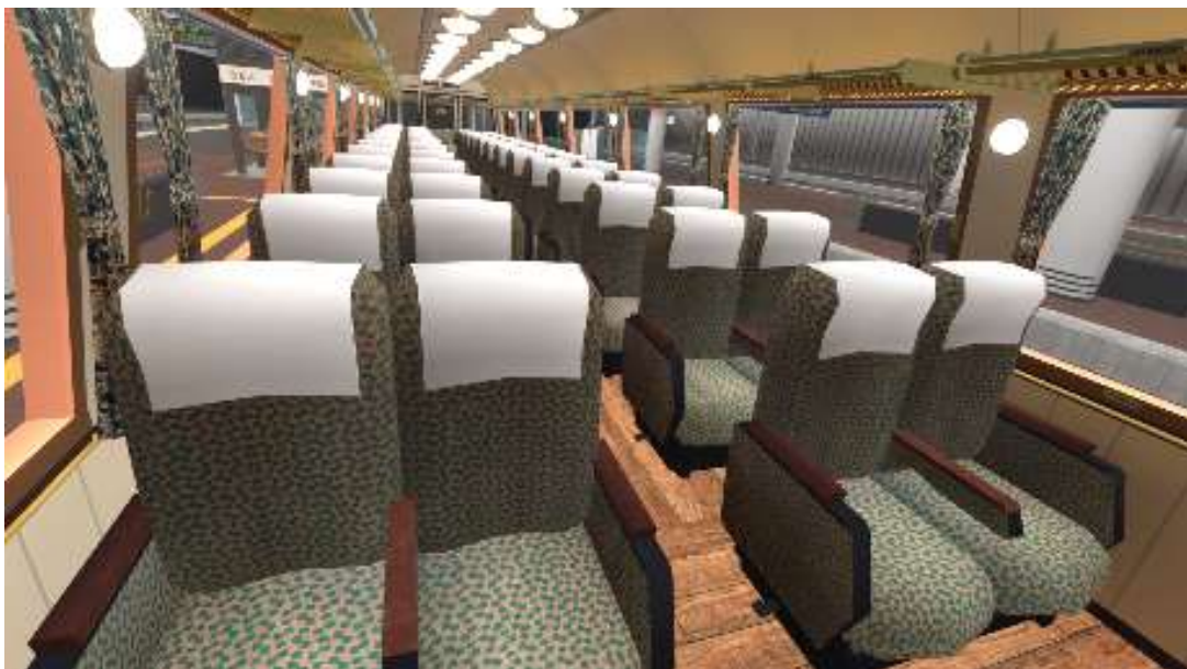
※画像は開発中のものです。

鹿児島本線・久大本線・日豊本線の福岡・大分エリアで運行する観光列車「ゆふいんの森」。「列車に乗った時からゆふいん」をテーマに作られた列車の特徴である、木の質感と深緑を色調とする座席で、レトロで高級感ある雰囲気の内装を再現。さらに、最後部では流れる景色を楽しめる車両のつくりを活かし、博多駅(外観)の変遷を遊ることができる“時間旅行体験”をご用意しました。