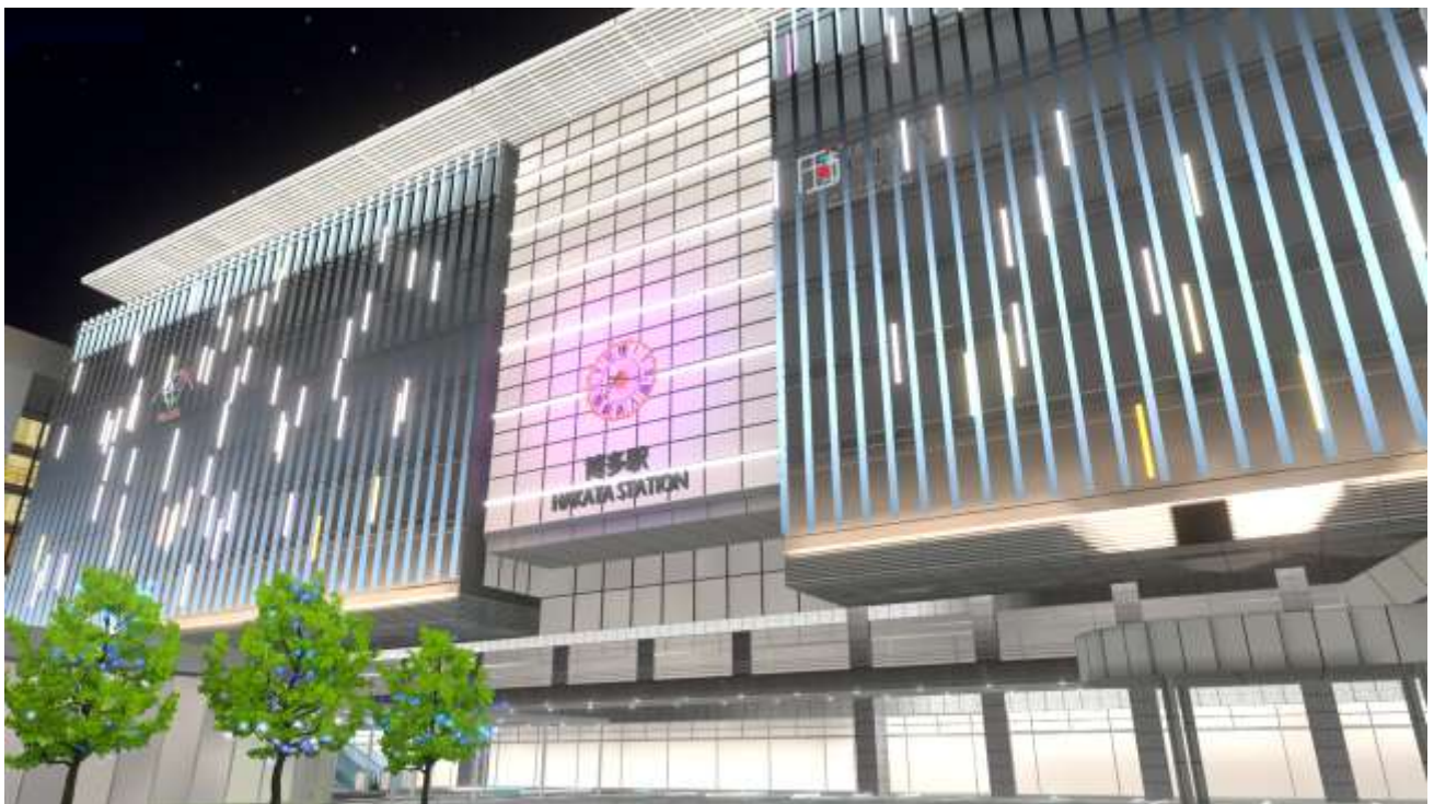
※画像は開発中のものです。

JR九州は、安全・安心なモビリティサービスを軸に地域の特性を活かしたまちづくりを通じて九州の持続的な発展に貢献すべく、価値観の変化を捉えた“豊かな生活を実現する”まちづくりと、九州の持続的な発展に貢献する領域の拡大に取り組んでいます。今回の取り組みは、「バーチャル博多駅」を通じて、従来のリアルでの体験や交流にとどまらない、バーチャル空間上での新たな体験・楽しみ方を提供するとともに、ライフスタイルの多様化に対応した交流を創出することで、新たな価値創造にチャレンジするものです。