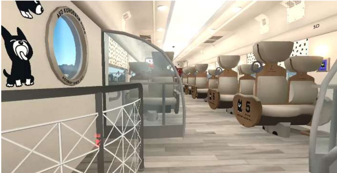
※画像は開発中のものです。

豊肥本線の熊本・阿蘇エリアで運行する観光列車「あそぼーい！」。「親子で楽しむ鉄道の旅」がテーマのこの列車から、3号車のファミリー車両をご用意しました。お子さまも車窓を楽しめるよう高した床や窓際に配置したお子さま用の小さめの座席、そして木のボールプールもきちんと再現。九州の観光体験の1つとして、「ふたつ星 4047」「あそぼーい！」「ゆふいんの森」が走る沿線の温泉に、木のボールプールが変化する“バーチャル温泉体験”を楽しめます。