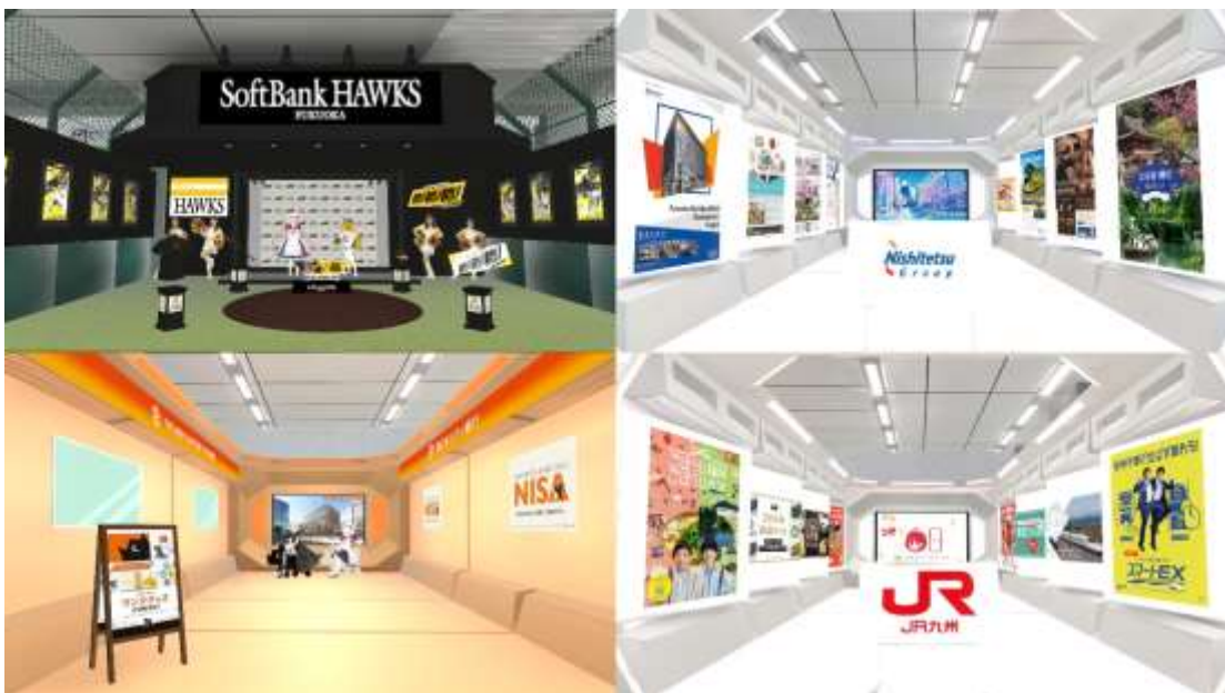
※画像は開発中のものです。

福岡の地元企業である「福岡ソフトバンクホークス」、「西鉄グループ」、「西日本シティ銀行」が登場！JR九州グループのみならず、各社がバーチャル博多駅にブースを設置し、国内外のお客さまをお迎えいたします。