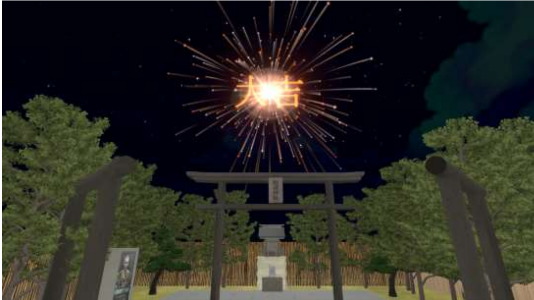
※画像は開発中のものです。

駅ビル「JR 博多シティ」の屋上にある「鉄道神社」。星門・福門・夢門含む神社を再現。厳かな空気感のある神社で、お参り体験が可能です。さらにお賽銭カードでキャッシュレスお賽銭をすると、おみくじ花火が打ち上がります。運試しと、新しいお参り体験をどうぞ！