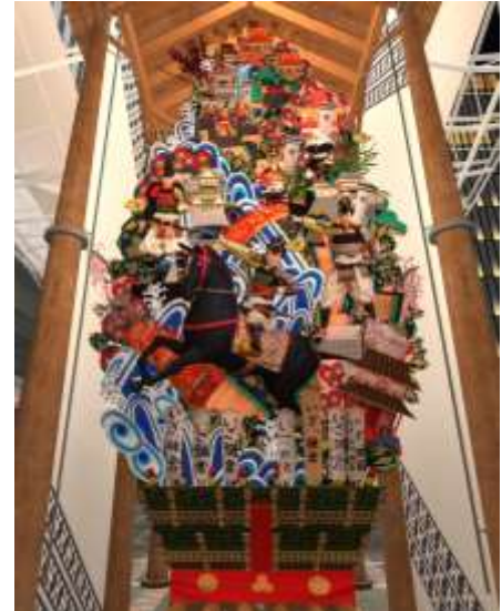
※画像は開発中のものです。

博多の風物詩、博多祇園山笠の「飾り山」が駅前広場に登場。リアルでの博多祇園山笠は7/1～15でも、バーチャル博多駅なら7/30まで「飾り山」を楽しめます。博多祇園山笠は、ユネスコ無形文化遺産であり、国指定重要無形民俗文化財です。700年以上もの伝統のある祭りを「飾り山」から感じてください。※設置の「飾り山」は2022年版の3Dモデルとなります。