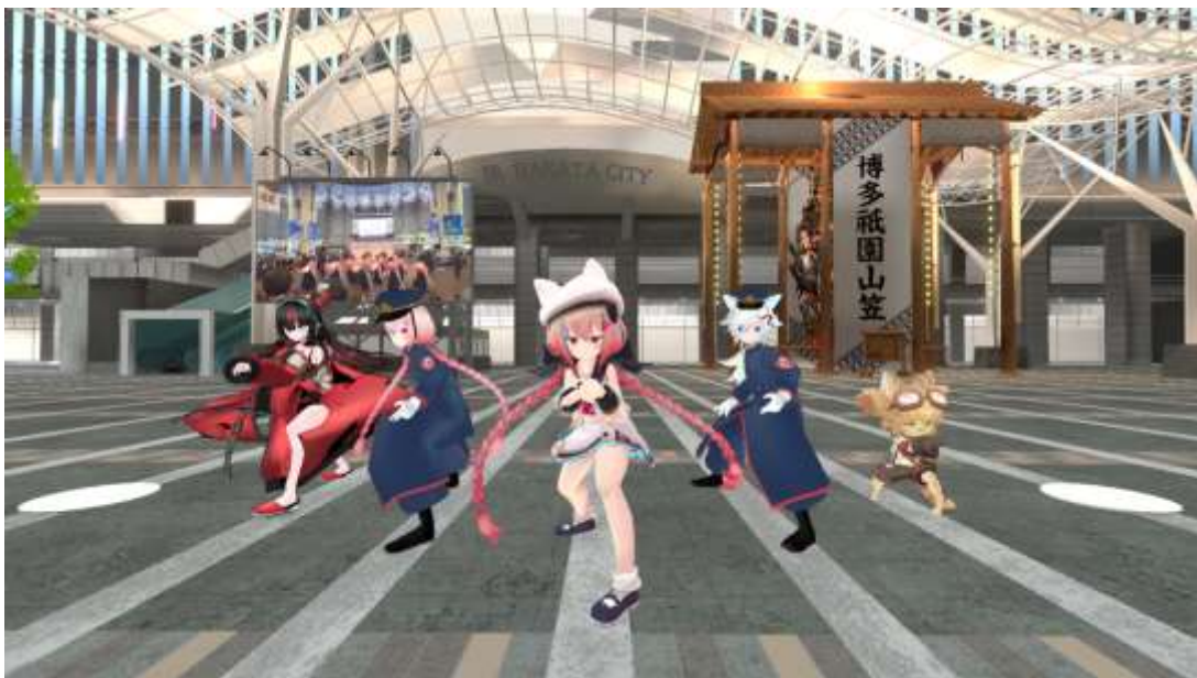
※画像は開発中のものです。

JR九州の人気よさこいチーム「櫻燕隊(おうえんたい)」が駅前広場に登場。「櫻燕隊」の制服を着たアバターと一緒に踊れる「よさこい体験」が可能です。「飾り山」と合わせて、夏のお祭り気分をどうぞ。※スマホ・タブレット・PCでの体験は、ご用意した櫻燕隊振付エモートによる体験となります。