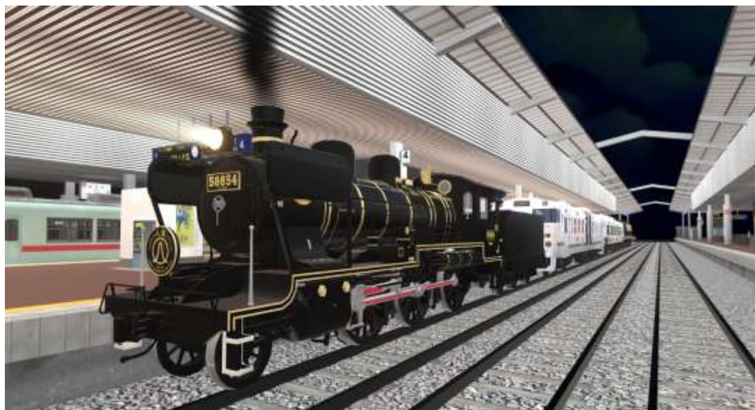
※画像は開発中のものです。

JR九州が運行するD&S列車(観光列車)の中から、「SL人吉」、「ふたつ星4047」、「あそぼーい!」、「ゆふいの森」の4つの列車を組み合わせ、ここでしか見ることができない列車をご用意しました。現実では運行していない、ありえない編成の列車をバーチャル博多駅でお楽しみください！