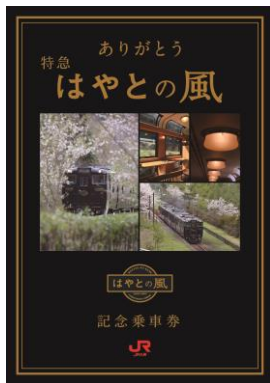
春バージョン(表面・裏面)