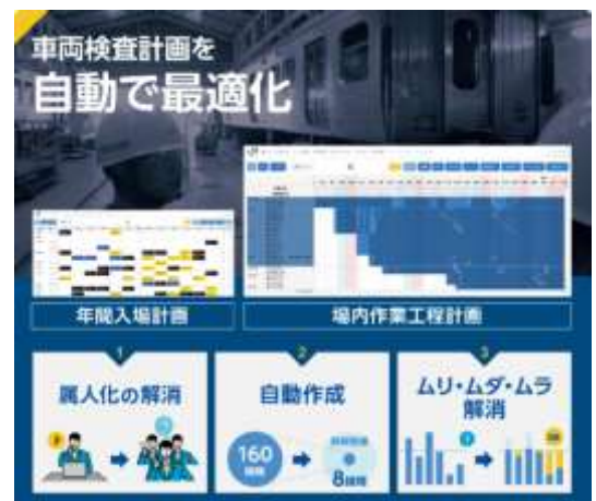
車両検査計画最適化システム