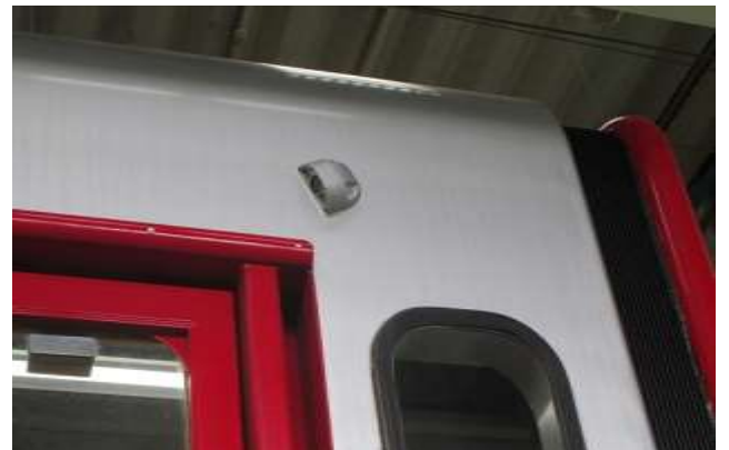
サイドビューカメラシステム