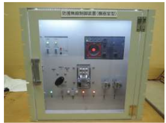
防護無線制御装置 (機器室型)