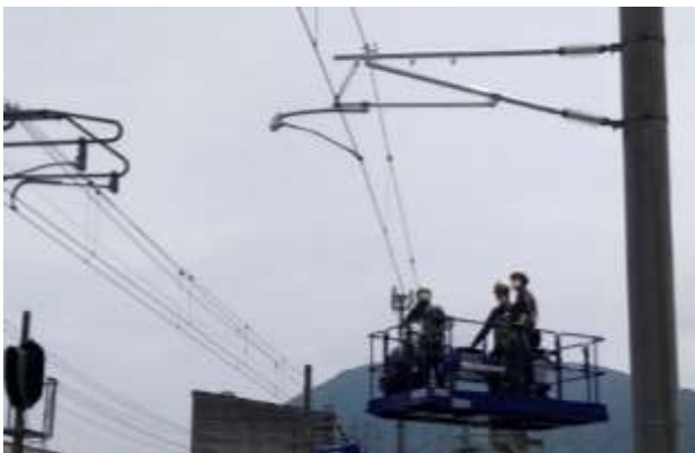
調整式 簡易復旧可動ブラケット