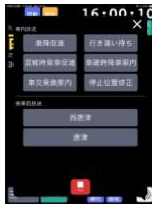
運転士支援/時刻表/自動放送アプリ「知らせる君」