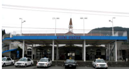
三角駅 リニューアル前

16世紀に天草に伝わった南蛮文化がテーマである「A列車で行こう」は、天草とともに歩んできました。文化や自然、食など、夏だけでなく四季折々の天草の魅力を多くの皆さまにお伝えするため、今後も地域の皆さまとともに様々な取組みをしてまいります。特急「A列車で行こう」でぜひ天草にお越しください！