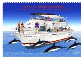
記念乗船証イメージ