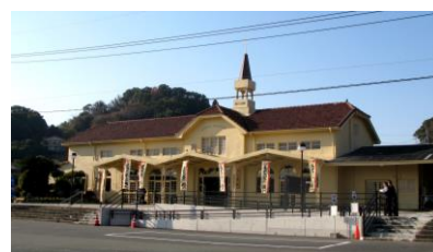
三角駅 リニューアル後