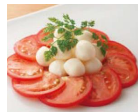
▲鉄板焼 天 博多 【朝どれ冷やしトマトのカプレーゼ】 鹿児島県南九州市で朝どれしたフルーッとトマトを使用

特別メニューなど詳しくは、こちらをご覧ください。(9月17日OPEN) ( https://www.jrhakatacity.com/kmonthnight2021/ )