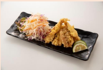
【もも焼き 伴鳥】 霧島鶏セセリ天