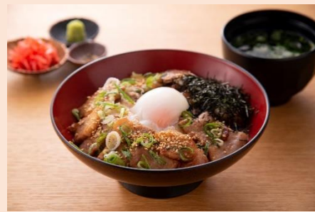
【うどん酒場 和八 わっぱち】 鹿児島県産黒豚の焼肉豚丼