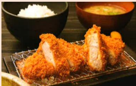
【鹿児島 黒かつ亭】 黒かつ亭弁当

産地から、新幹線を活用した荷物輸送で当日届く旬の食材など逸品を集めて1日数時間だけ、毎週火曜日、駅にオープンするマルシェです。生産者が育てる豊かな食材で、食べる人もつくった人も元気になれるマルシェをめざしています。開催情報は「つばめマルシェ」公式 Instagram をご確認ください。