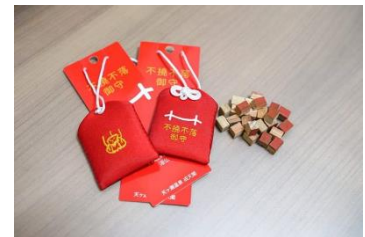
ふとろふらく 不撓不落御守