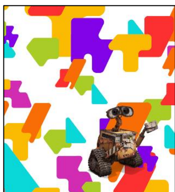
▲ウォーリー 海幸山幸