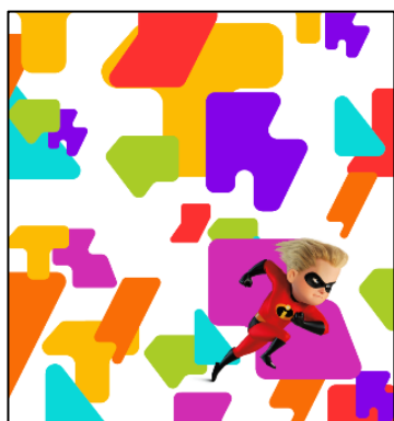
▲Mr. インクレディブル ゆふいんの森 I 世