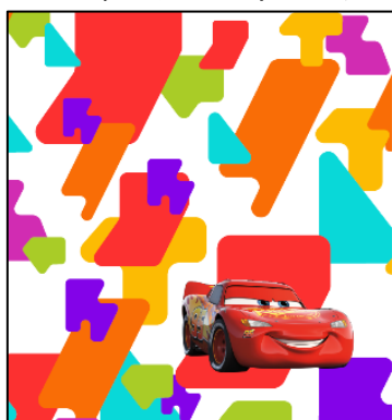
▲カーズ A列車で行こう