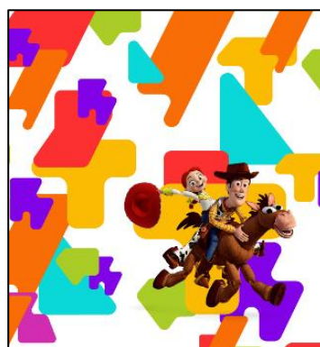
▲トイ・ストーリー かわせみ やませみ、 いさぶろう・しんぺい