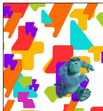
▲モンスターズ・インク 指宿のたまて箱