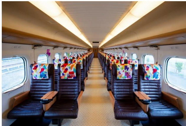
<「JR九州 WAKU WAKU ADVENTURE 新幹線」車内>