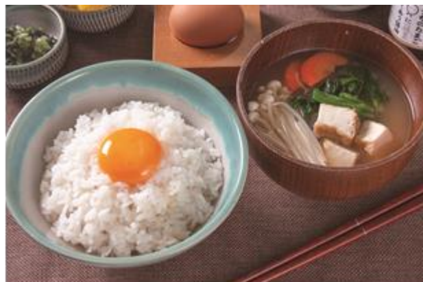
うちのたまごの たまごかけご飯 580 円 (税込)

フレッシュトマトにとろ〜りとろけるチーズがたまらない生パスタ。アツアツもちもちの生パスタに絡む、とろけるモッツァレラの食感をお楽しみください。