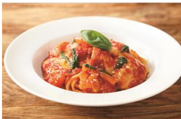
とろ〜りモッツァレラの トマトソース 880 円 (税込)

フレッシュトマトにとろ〜りとろけるチーズがたまらない生パスタ。アツアツもちもちの生パスタに絡む、とろけるモッツァレラの食感をお楽しみください。