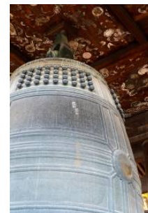
方広寺「国家安康」の梵鐘 （重要文化財）

JRグループでは、2021年1月から3月にかけて京都市、公益社団法人京都市観光協会（DMO KYOTO）と連携した京都デスティネーションキャンペーン「京の冬の旅」を実施します。第55回目を迎える今回は「京都に見る日本の文化」をメインテーマに、「非公開文化財特別公開」をはじめ、テーマに合わせて定期観光バスで巡る特別コースなど、多彩なイベントを実施します。