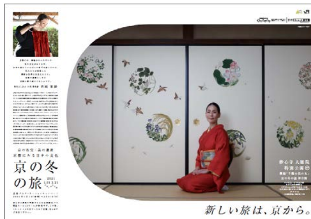
JRグループの各駅・車内で展開するポスターの一例