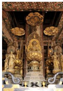
東寺 五重塔（国宝）内部