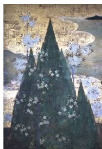
妙蓮寺「鉢杉図」 （重要文化財）