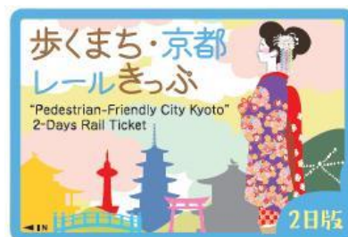
<歩くまち・京都レールきっぷ（2日版）券面>