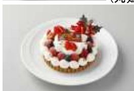
(ホテルオリジナル クリスマスケーキ)