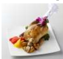
(丸鶏ローストチキン)