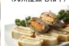
(サンドイッチ盛り合わせ)