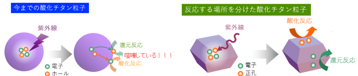
一般の光触媒粒子（左）と反応サイトが分離されて、電子と正孔が反応する場所が異なる光触媒粒子（右）の反応の模式図

光触媒はその反応機構上、光照射下で酸化反応と還元反応という正反対の反応がナノレベルの球状粒子上で同時に進行します。そのため容易に逆反応が進行してしまい、大幅な触媒性能の低下をもたらします。横野研究室では、この解決しなければならない最重要の課題について、ナノレベルで光触媒粒子表面の反応場を分離する方法を見出して、完全に解決することに成功しました。