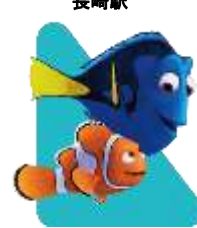
『ファインディング・ニモ』