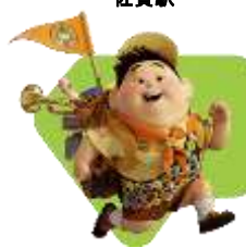
『カールじいさんの空飛ぶ家』