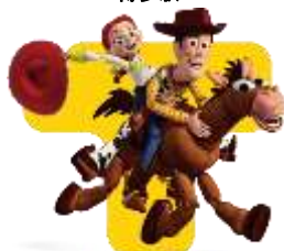
『トイ・ストーリー』