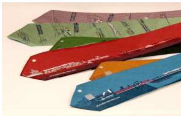
豊肥本線全線開通記念ネクタイ