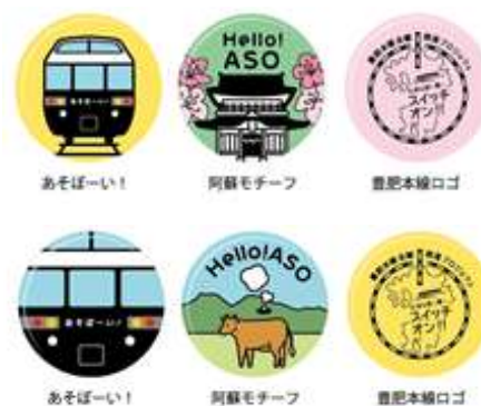
スイッチオン缶バッジ3個セット