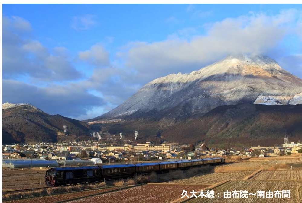
久大本線：由布院～南由布間

※3泊4日コースは2泊目にご宿泊いただく宿により旅行代金が異なります。(スイート【由布院玉の湯又は亀の井別荘又は山荘無量塔】、DXスイートB【由布院玉の湯】、DXスイートA【亀の井別荘】)なお、1名さま1室利用の場合、3名さま1室利用の場合は、パンフレット又は「ななつ星」専用ホームページをご参照下さい。