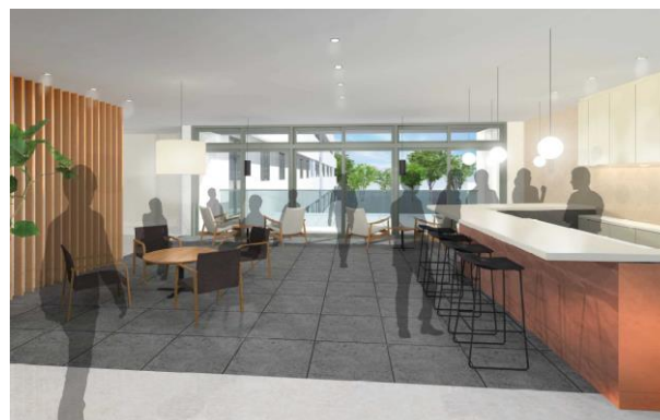
〔交流スペースイメージ〕