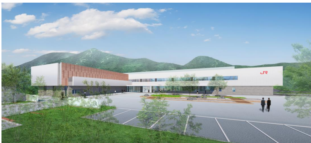
〔新社員研修センター外観イメージ〕