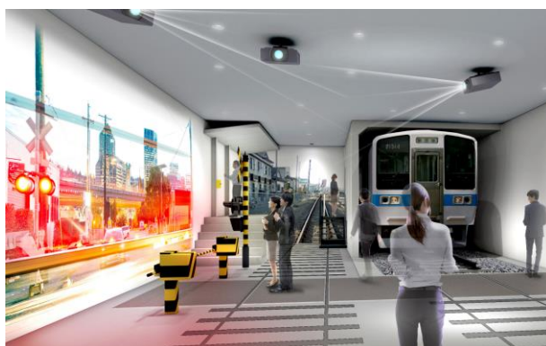
〔安全創造館イメージ〕