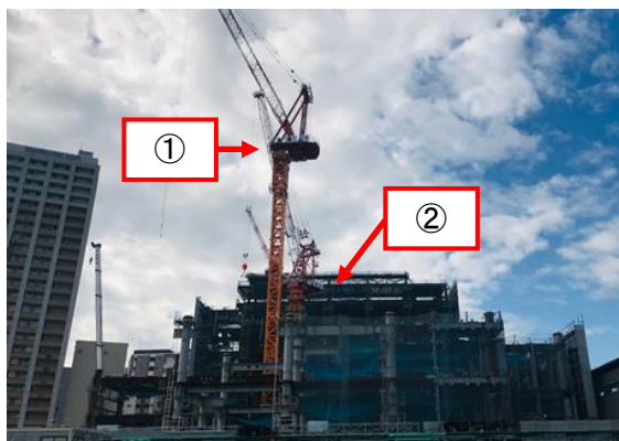
熊本駅ビル ①くまモンのクレーン ②くろちゃんのクレーン