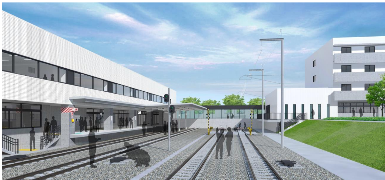
〔実習線・模擬ホームイメージ〕