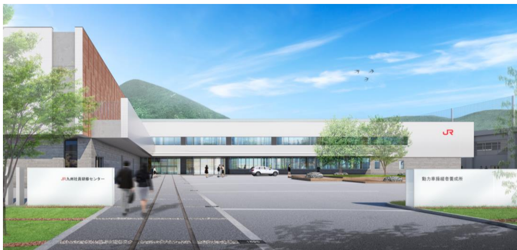
〔新社員研修センター外観イメージ〕