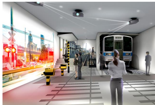
〔安全創造館イメージ〕