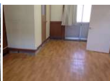
唐津線山本駅（学習塾として活用）