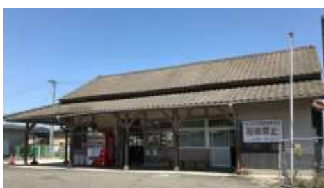
日豊本線今津駅（社会福祉法人事務所として活用）