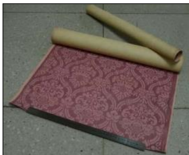
発見物 (貴賓室壁紙)

門司港駅舎の見どころをまとめた「門司港見どころガイド (動画)」や門司港駅舎保存修理工事記録をまとめた「工事修理記録 (動画)」を駅舎内で放映します。