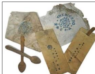
発見物 (みかど食堂の 木製スプーン・紙ナプキン)