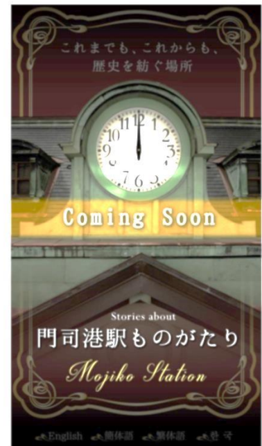
ポータルサイトイメージ

https://www.jrkyushu.co.jp/company/mojiko_sta