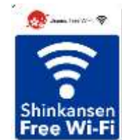
「Shinkansen Free Wi-Fi」 ステッカー