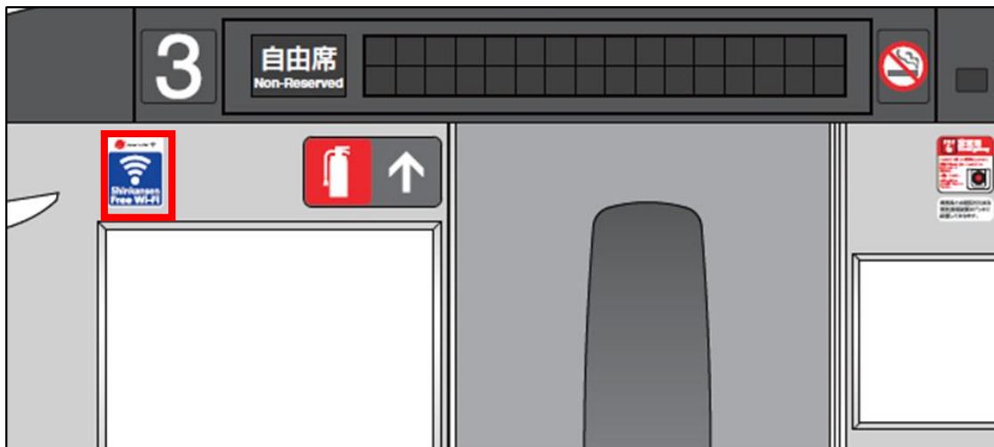
N700系における「Shinkansen Free Wi-Fi」ステッカーの掲出イメージ