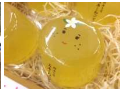
幻の柑橘「くねぶ」商品の PR