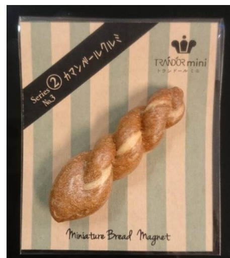
カマンベールクルミ