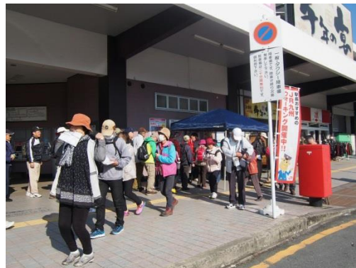
11月3日(木・祝) 大牟田駅