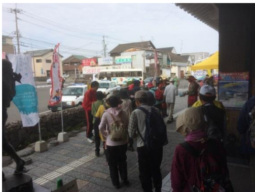
10月30日(日) 島原鉄道「島原駅」