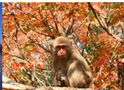
大分・高崎山の紅葉