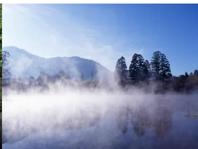
由布院・金鱗湖の朝霧