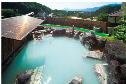
別府の豊富な温泉