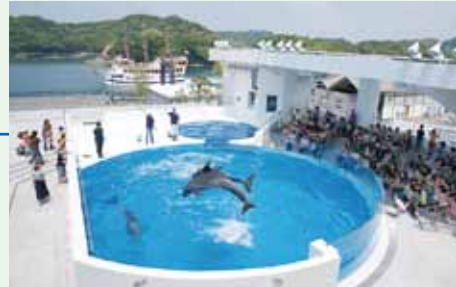
「九十九島イルカプール」

豊かな自然と様々な生き物たちが息づく「海きらら」は魅力がいっぱいです。イルカと心ふれあう「九十九島イルカプール」では、ハンドウイルカとハナゴンドウが海をバックにかわいい姿を見せてくれます。