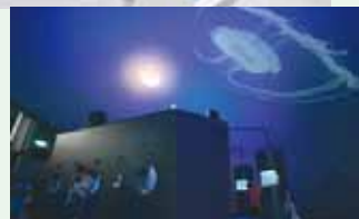
「クラゲシンフォニードーム」

「クラゲシンフォニードーム」では、神秘的クラゲ、幻想的な光、心やすらぎ音楽、優雅に泳ぐクラゲの映像。それぞれがおりなす癒しのシンフォニーを聴くことができます。