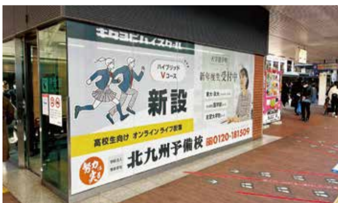
外側から見た様子