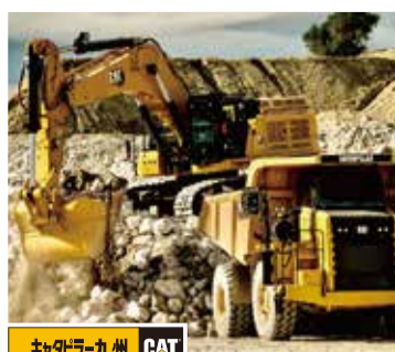
キャタピラー九州株式会社：福岡県筑紫野市(建設機械販売・レンタルサービス)