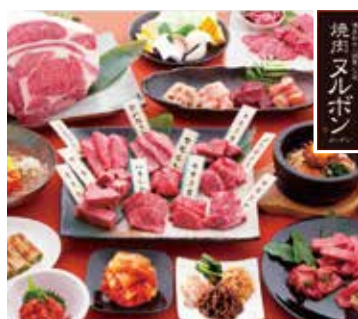
株式会社ヌルボン：福岡県福岡市(焼肉レストラン)