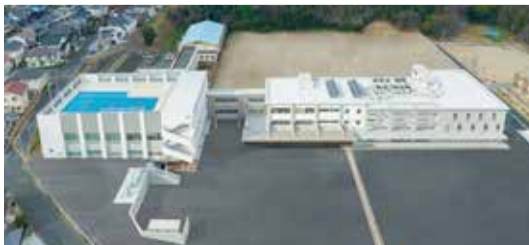
小池特別支援学校改築工事：福岡県(九鉄工業株式会社)