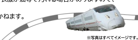
※写真はすべてイメージです。