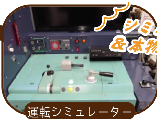
運転シミュレーター

大分車両センターに到着したら 運転士を指導する「指導運転士」と 一緒に列車の格納庫で運転! 体験 車両：キハ220形1両