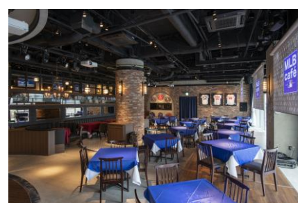
MLB café FUKUOKA