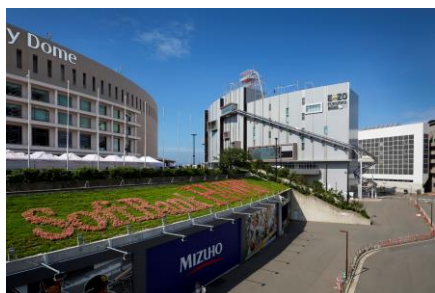
BOSS E-ZO FUKUOKA

今回のツアーでは「ファミリーピクニック」をテーマに、家族でお楽しみいただける内容をご用意しております。博多駅からPayPayドームまでは、JR九州バスにて移動。その後、PayPayドームツアーやBOSS E・ZO FUKUOKA内の「MLB café FUKUOKA」にてピクニックランチプレートの食事に、常設ミュージアムである「チームラボフォレスト 福岡 - SBI証券」をお楽しみいただける入場券がついた、PayPayドームとBOSS E・ZO FUKUOKAを満喫できる1日限定ツアーです。お申し込みを心よりお待ちしております。