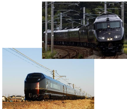
旅行商品で利用する列車（イメージ）