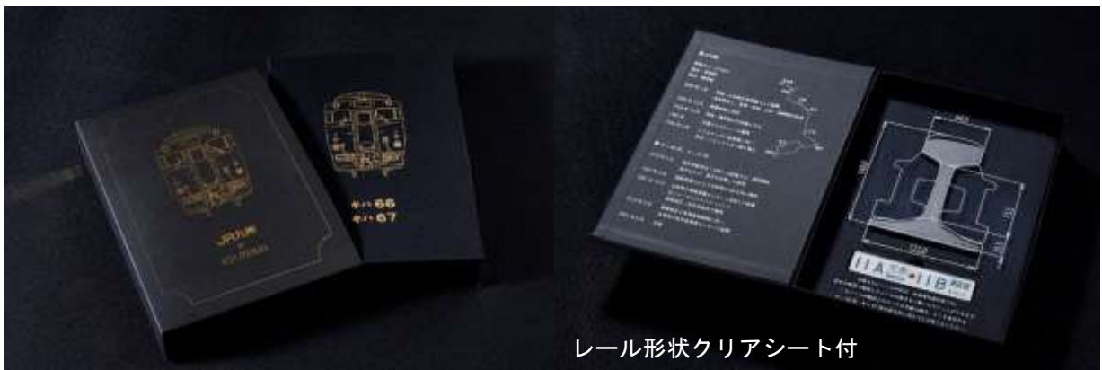
レール形状クリアシート付