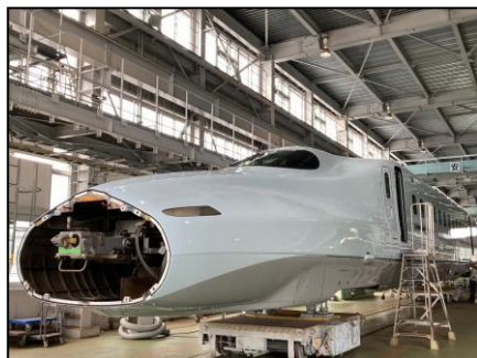
新幹線がこんなに近くで見られます!