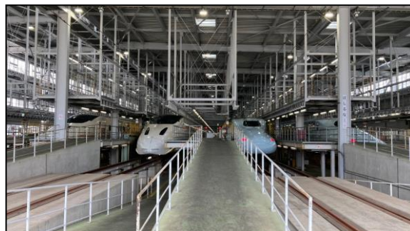
新幹線の前で記念撮影