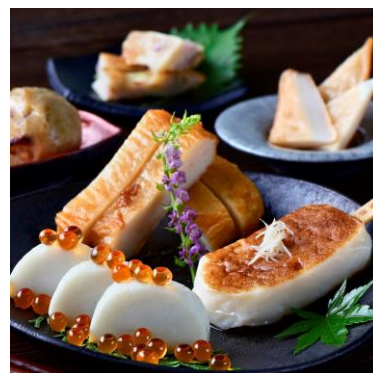
[土産(物販)ゾーン イメージ]