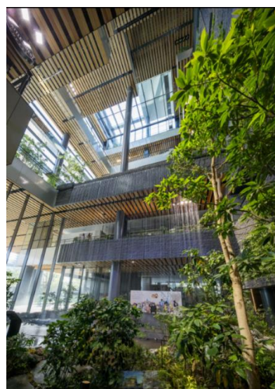
ぼうけんの杜（水と緑の立体庭園）