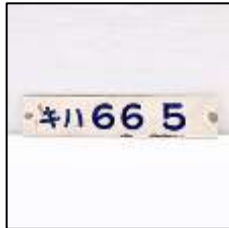
車内形式板(手書き) 25,300円