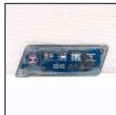
車内銘板(新潟鐵工) 16,500円