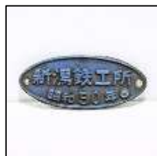
製造銘板(新潟鐵工所) 36,300円