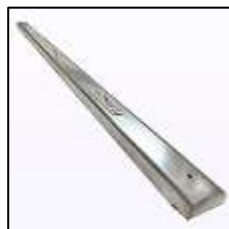
席番(クロスシート)(下板付) 1,650円