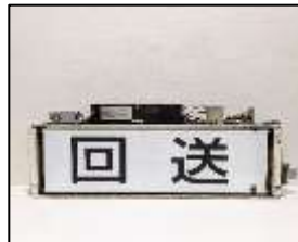
行先表示器(方向幕付)