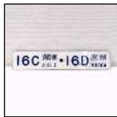
席番(クロスシート) 1,100円