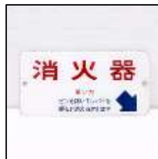
案内銘板(消火器) 2,200円