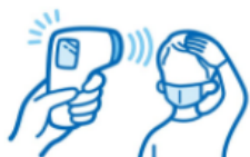
検温 (ターミナル入館時)