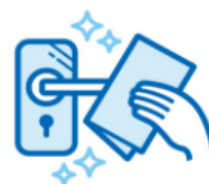
共用部の消毒強化