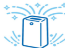
空気清浄機の設置