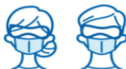
スタッフのマスク着用