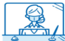
飛沫防止パネルの設置