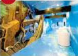
ツビタの青雲画を展示した「空と雲の部屋」

「天空の城ラピュタ」「火垂るの墓」「もののけ姫」「時をかける少女」等、数々の名作アニメーションで美術監督を務めてきた山本二三氏の描いたアニメーションの背景面などを展示する美術館です。