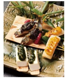
六甲みそ 田楽味噌詰合

【冬】京つけもの西利 古都の朝、福寿園 伊右衛門シリーズ缶詰め合わせ、 笹屋伊織 千客万来、豆政 京ごのみ 豆づくし