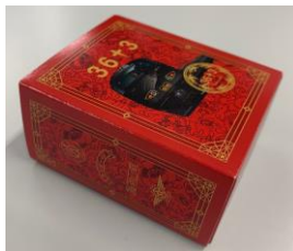
花の種 入れ物(イメージ) サイズ:横50mm×縦60mm×高さ 30mm