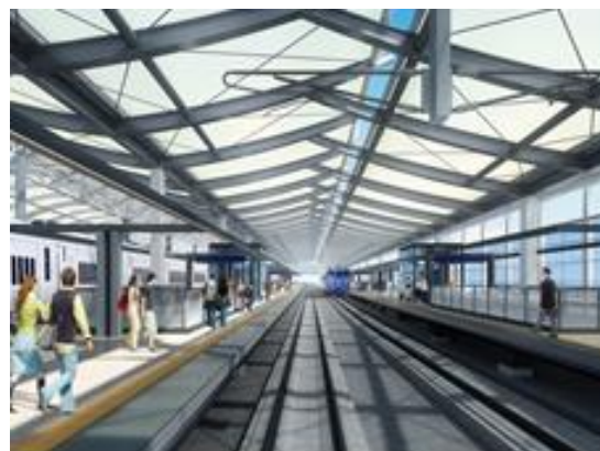
《 長崎駅内観 》