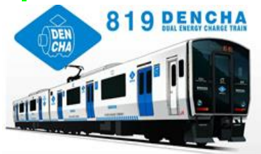
【香椎線・鹿児島本線 直通列車 イメージ】

香椎線 西戸崎駅 (7:46 発) 鹿児島本線 博多駅 (8:31 着) の直通列車を運行します。これにより香椎駅での乗り換えをせず博多方面へご利用いただけます。