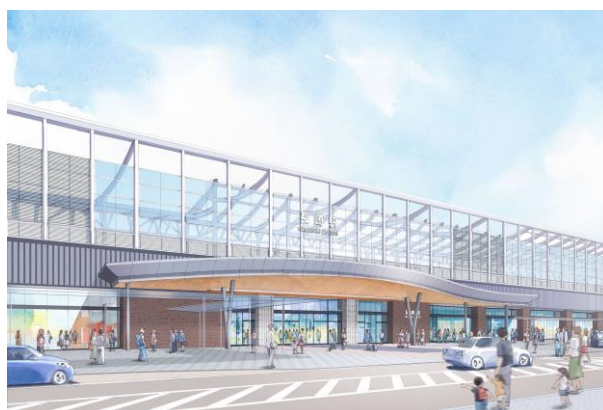
《 長崎駅外観 》