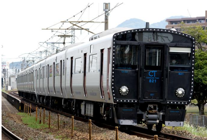
【運行区間】鹿児島本線 門司港駅 ~ 荒木駅