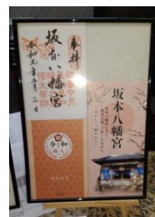
<坂本八幡宮御朱印>