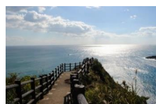
日向岬・馬ヶ背のイメージ