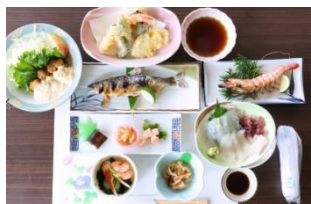
※仕入れ状況により一部変更になる場合がございます。

是非この機会に、歴史ある神社で新年の願いを込め、自然と文化にふれる一日をお楽しみください。皆さまのお申し込みをお待ちしております。