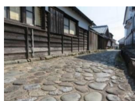
美々津重要伝統的建造物群保存地区のイメージ