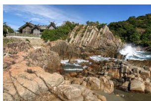
大御神社のイメージ