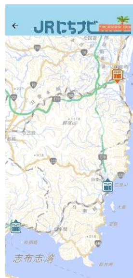
地図上で在線位置と 遅延状況を確認