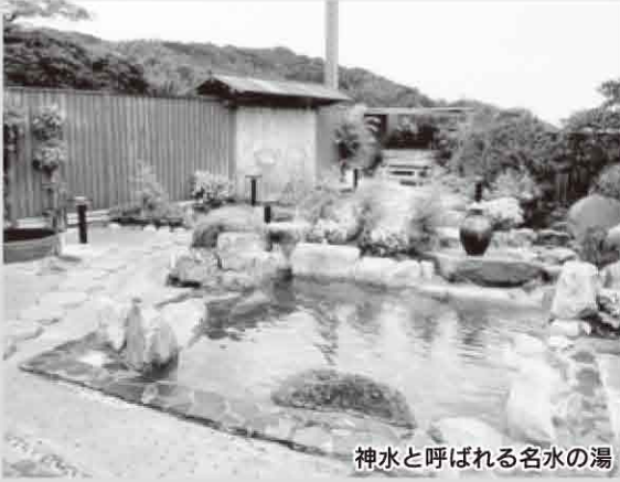
神水と呼ばれる名水の湯