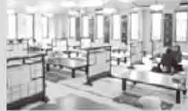
お食事処十坊「TONBO」 旬な食材を豊富なバリエーションで